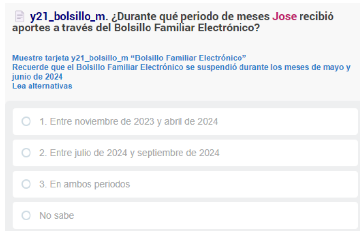
Figura 4: Pregunta y21_bolsillo, identifica período en que recibió el Bolsillo Familiar Electrónico

La tercera pregunta ( y21_bolsillo_p ) tiene como objetivo identificar el número de causantes por los cuales se recibió este beneficio.