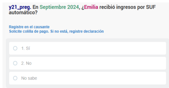
Figura 1: Pregunta y21preg, identifica si recibió el Subsidio Familiar Automático